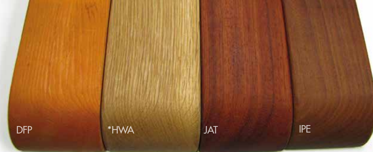
*Chêne Blanc (WOA) ici démontré