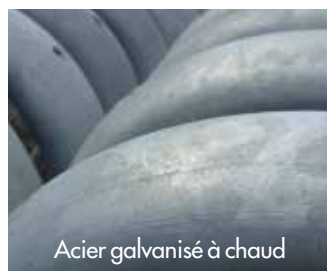
Acier galvanisé à chaud

Nos structures d'aluminium se distinguent par leur caractère léger et inoxydable. L'application d'une peinture en poudre par procédé électrostatique ajoute une protection et une finition supérieures.